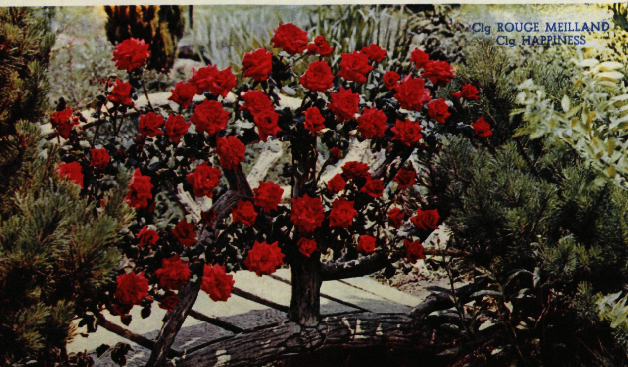
Clg ROUGE MEILLAND Clg HAPPINESS